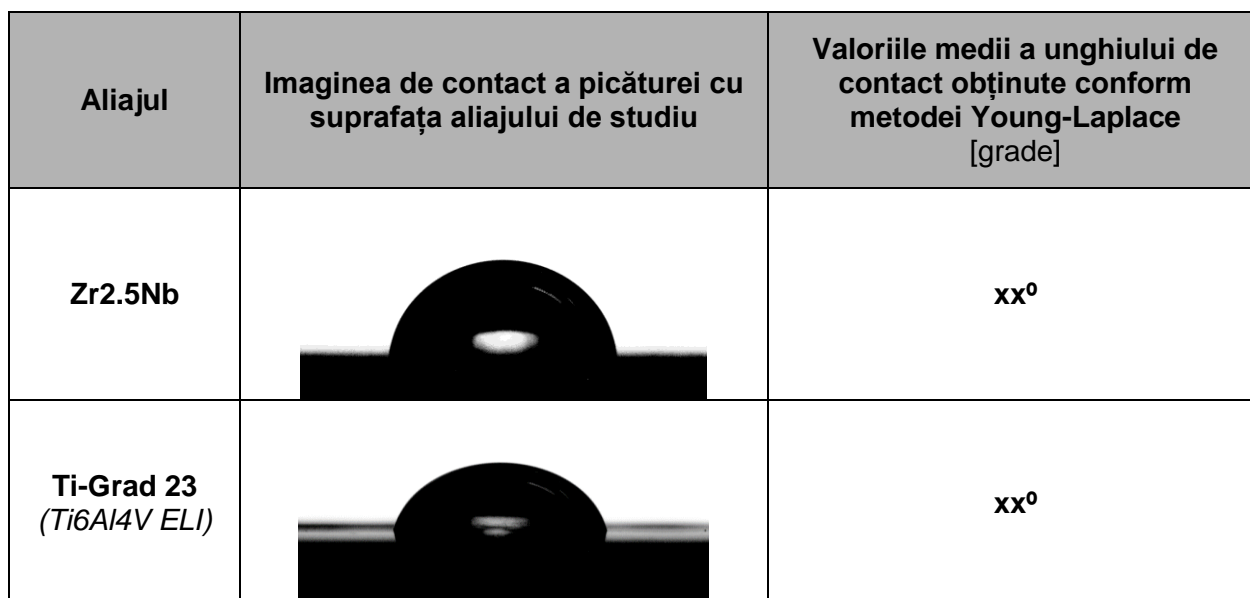
Tabel 5.5 Imagini a picăturii și valorile medii măsurate a unghiului de contact pe suprafețelor netratate a aliajul de Zr2.5Nb și Ti-Grad 23

În tabelul 5.5 sunt afișate valorile medii obținute pentru aliajele de studiu netratate, astfel se poate constata un unghi de contact de sub 90^\circ atât pentru aliajul de Zr2.5Nb cât și pentru Ti-Grad 23, fiind considerate materiale cu suprafețe hidrofile.